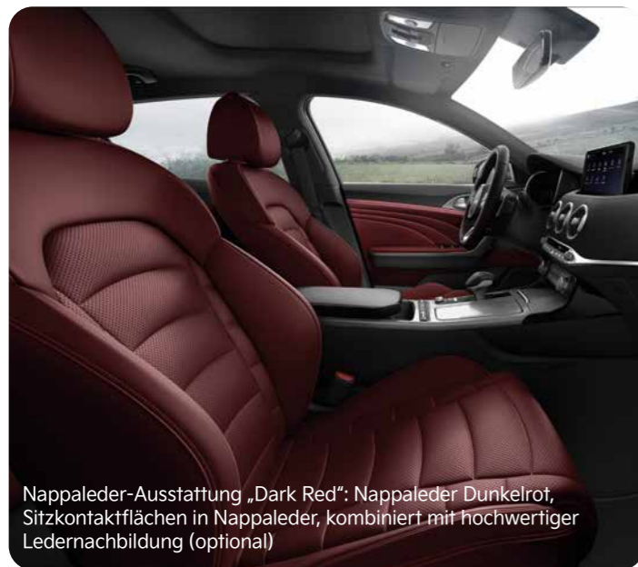
Nappaleder-Ausstattung „Dark Red“: Nappaleder Dunkelrot, Sitzkontaktflächen in Nappaleder, kombiniert mit hochwertiger Ledernachbildung (optional)