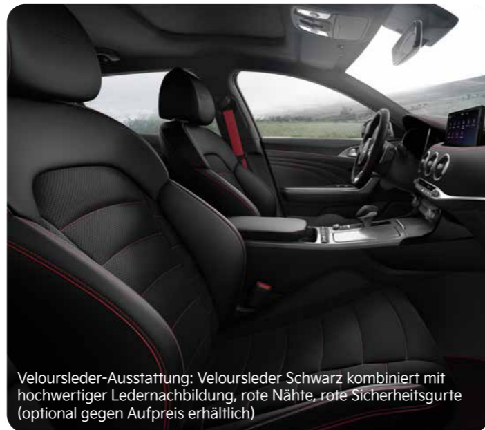
Veloursleder-Ausstattung: Veloursleder Schwarz kombiniert mit hochwertiger Ledernachbildung, rote Nähte, rote Sicherheitsgurte (optional gegen Aufpreis erhältlich)