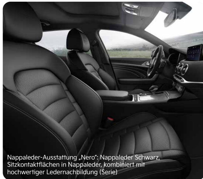
Nappaleder-Ausstattung „Nero“: Nappaleder Schwarz, Sitzkontaktflächen in Nappaleder, kombiniert mit hochwertiger Ledernachbildung (Serie)

Im luxuriösen Interieur des Kia Stinger GT sind die Sitze serienmäßig mit Nappaleder bezogen (jeweils Sitzkontaktflächen in Nappaleder, kombiniert mit hochwertiger Ledernachbildung). Neben Schwarz ist die Lederausstattung optional auch in Rot erhältlich oder du entscheidest dich für die Kombination aus schwarzem Veloursleder, hochwertiger Ledernachbildung und roten Nähten.