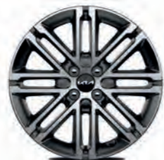
17-Zoll-Leichtmetallfelgen (Platinum, optional für Spirit)