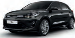
Auroraschwarz Metallic (ABP)