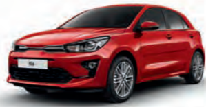
Signalrot Metallic (BEG)