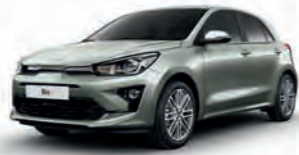
Urbangrün Metallic (URG)*, nicht für GT-line