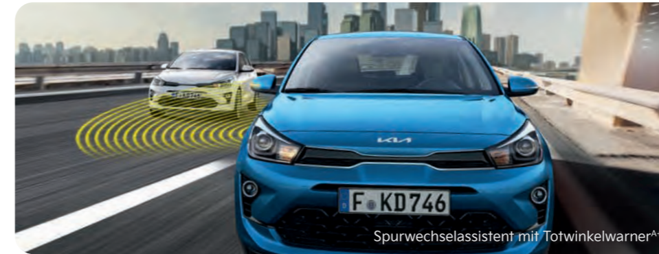
Spurwechselassistent mit Totwinkelwarner A+

Mit einem breiten Spektrum an aktiven Sicherheitssystemen A unterstützt Dich der Kia Rio dabei, in Gefahrensituationen schnell und angemessen zu reagieren. Hier siehst Du einen Auszug. Ausführliche Informationen zu den Assistenzsystemen findest Du in der Broschüre des Kia Rio unter www.kia.com/de/broschuere .