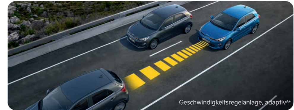
Geschwindigkeitsregelanlage, adaptiv A+

Per Kamera und Radar misst die adaptive Geschwindigkeitsregelanlage (Smart Cruise Control, SCC) A+ die Distanz zum vorausfahrenden Fahrzeug sowie dessen Geschwindigkeit. Wird der festgelegte Sicherheitsabstand unterschritten, bremst das System den Kia Rio ab. Nur für Doppelkupplungsgetriebe.