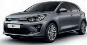
Perennialgrau Metallic (PRG)