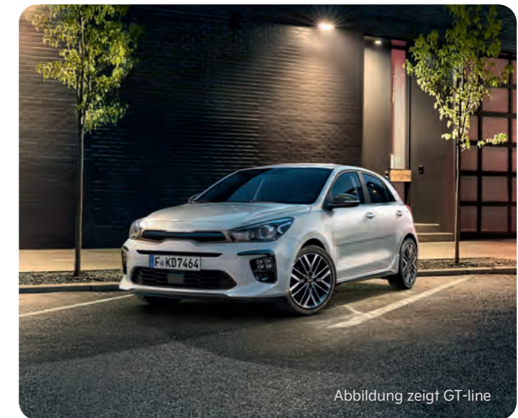
Abbildung zeigt GT-line

Abbildungen zeigen kostenpflichtige Sonderausstattung.