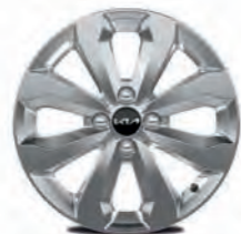
16-Zoll-Leichtmetallfelgen (Vision und Spirit)