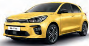
Floridagelb Metallic (MYW), nur für GT-line