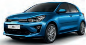
Bathysblau Metallic (SPB)

Bei einigen unserer modernen Metallicfarben werden bewusst unterschiedliche Farbpigmente verwendet. Dadurch können unter bestimmten Lichtverhältnissen, z. B. direktes Sonnenlicht, attraktive Farbeffekte erzielt werden. Zum Teil kann die Farbe changieren, z. B. von Schwarz zu Dunkelblau. Bei den hier abgebildeten Farbdarstellungen kann es aufgrund der Drucktechnik zu Abweichungen zu den Originalfarben kommen. Weitere Informationen zu den Farbeffekten und Grundfarben erhältst Du bei Deinem Kia-Partner. Metalliclackierungen sind aufpreispflichtig.