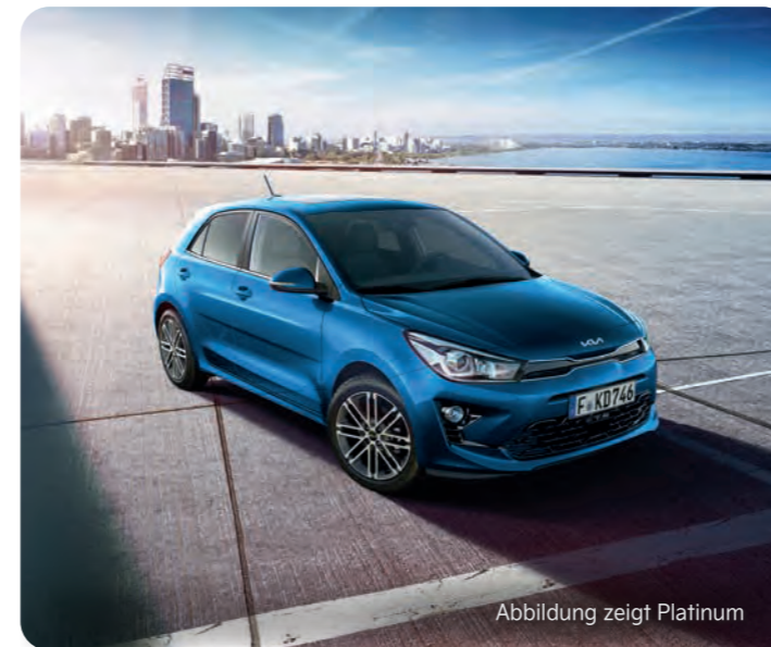
Abbildung zeigt Platinum