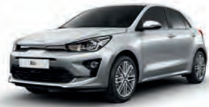
Seidensilber Metallic (4SS)*, nicht für GT-line