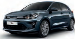
Denimblau Metallic (EU3)*, nicht für GT-line