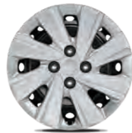
15-Zoll-Stahlfelgen (Edition 7)