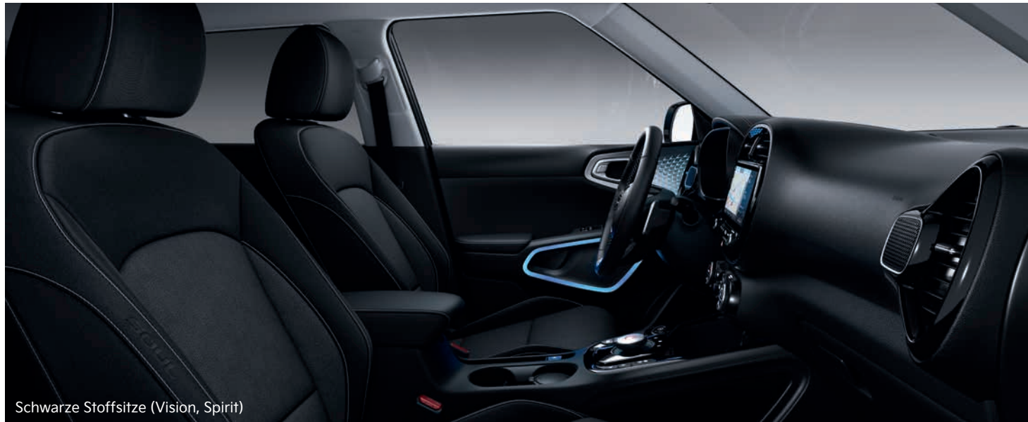
Schwarze Stoffsitze (Vision, Spirit)

Im Innenraum kommen sorgfältig ausgewählte Materialien zum Einsatz, damit du dich vom ersten Moment an wohlfühlst. Je nach Ausstattungsvariante stehen für die Sitze schwarze Bezüge in Stoff oder Leder zur Wahl.