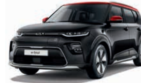
Fusion Black Met. mit Kontrastfarbe Rot (FA1)