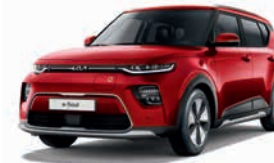
Infernorot Metallic (AJR)