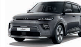
Gravitygrau Metallic (KDG)