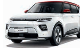
Schneeweiß mit Kontrastfarbe Rot (AH1)