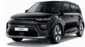
Fusion Black Metallic (FSB)