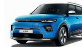
Surf Blue mit Kontrastfarbe Weiß (AH8)