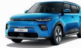
Surf Blue (SRB)