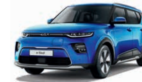
Neptunblau Metallic (B3A)