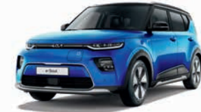
Neptunblau Metallic mit Kontrastfarbe Schwarz (FB1)