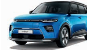
Surf Blue mit Kontrastfarbe Schwarz (FB3)