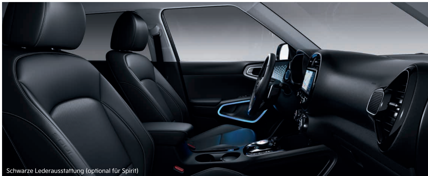
Schwarze Lederausstattung (optional für Spirit)

Abbildungen zeigen kostenpflichtige Sonderausstattung.