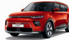
Marsorange Metallic (M3R)