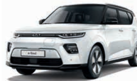
Schneeweiß mit Kontrastfarbe Schwarz (F1D)