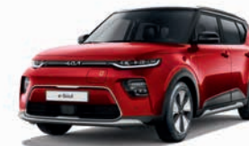
Infernorot Met. mit Kontrastfarbe Schwarz (FA2)